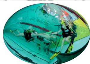
Relais 4*50 m